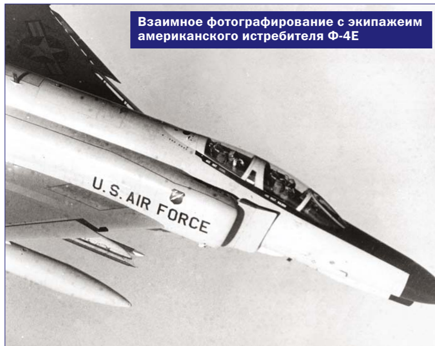
Взаимное фотографирование с экипажем американского истребителя Ф-4Е

работавшая в экстремальных условиях, дала сбой, но, вероятно, и ему иногда требовалась разрядка.