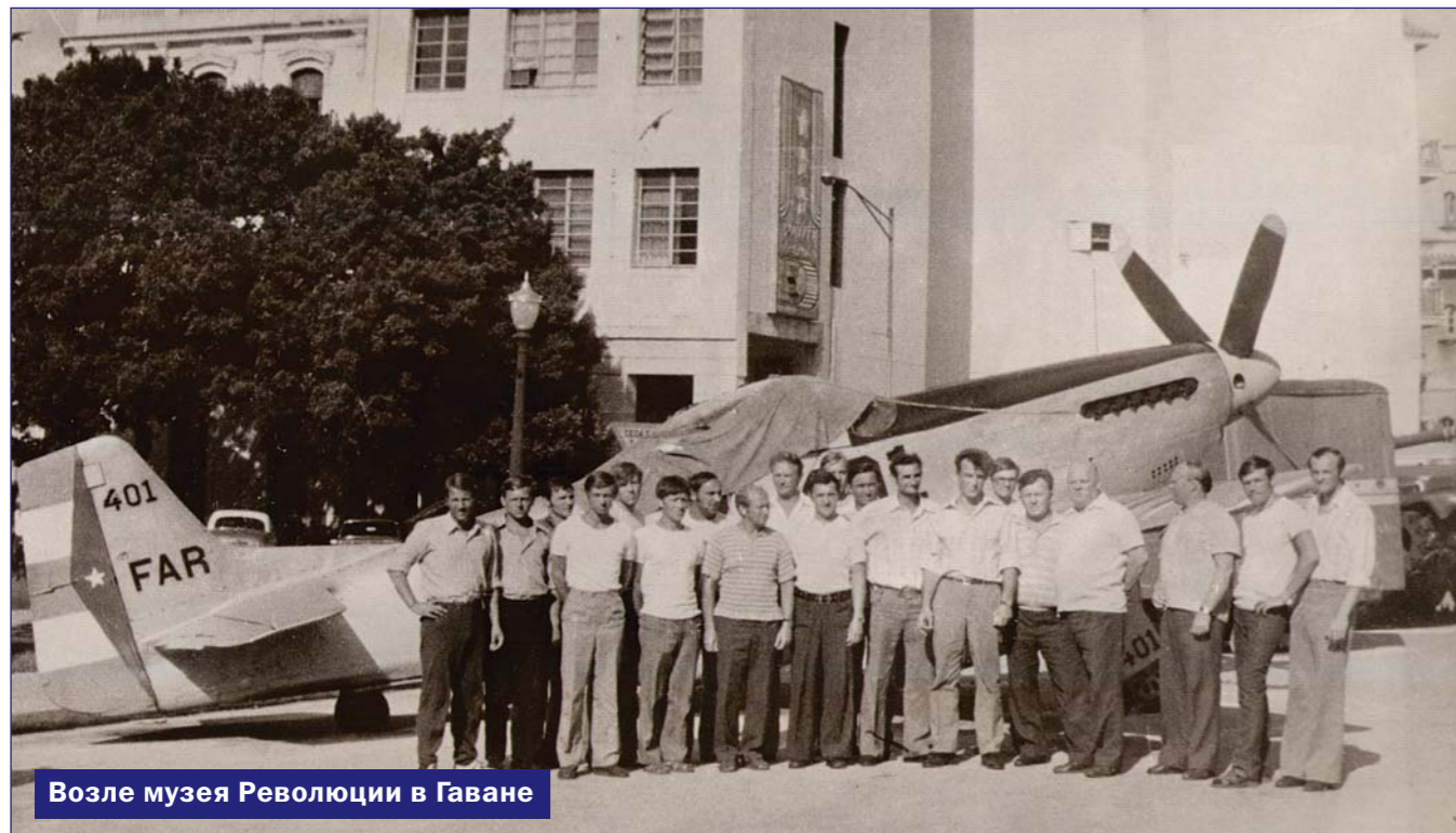
Возле музея Революции в Гаване

Прямолинейный пассивный полёт экипажам перехватчиков был явно скучен и лётчик-оператор ведущего "Фантома" попытался установить дружественные отношения с экипажем "Медведя". Прежде всего, он жестами предложил улыбнуться для взаимной фотосъёмки. После того как импровизированная фотосессия была закончена, он поднял к фонарю своей кабины иллюстрированный журнал с эффектным снимком великолепной блондинки в весьма откровенном "бикини". Ну что же, эти американские парни, наверное, тоже были ещё очень молоды. И, тем не менее, несмотря на столь либеральное поведение, в действиях экипажей перехватчиков чётко угадывался глубокий профессионализм, и где-то на под-