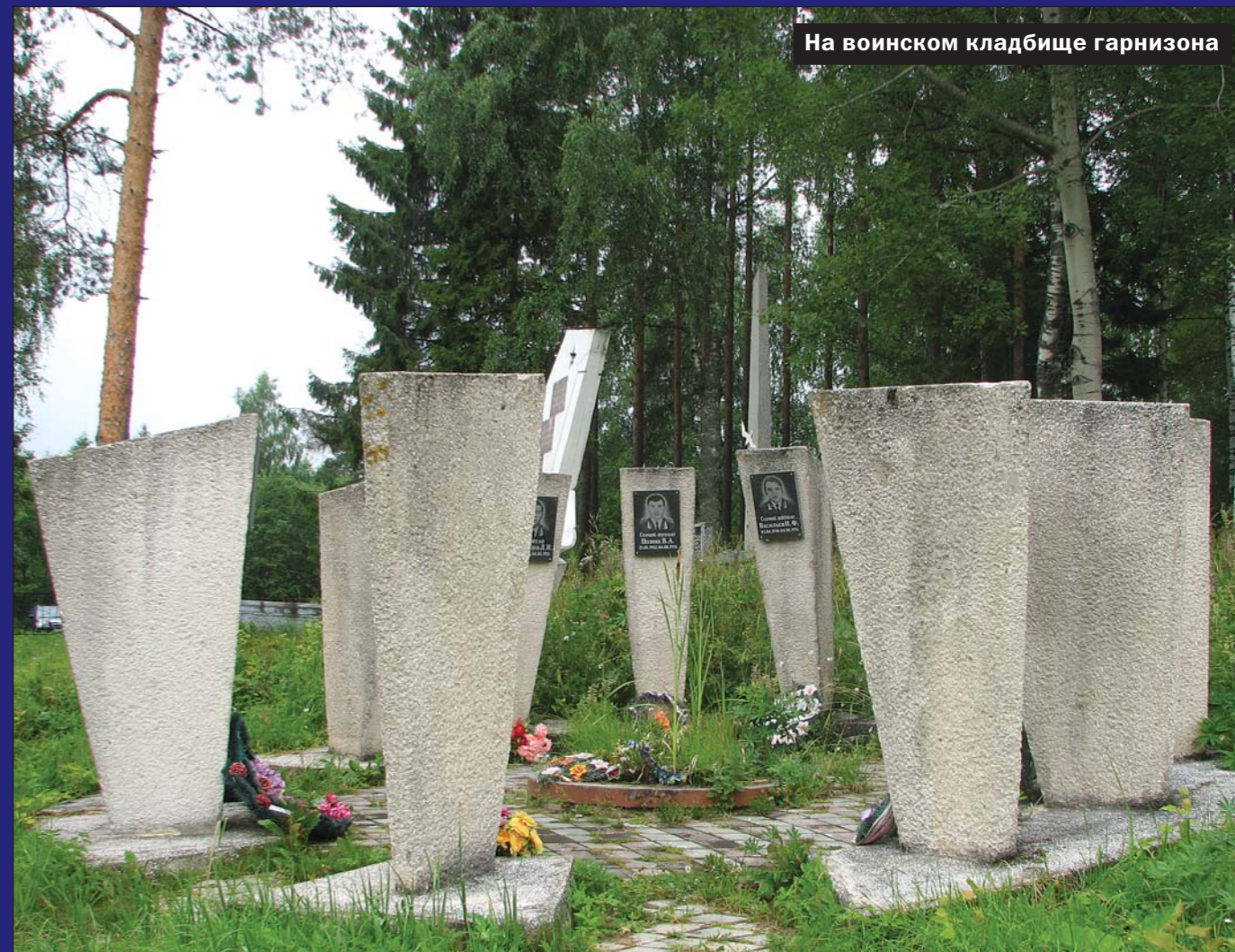
На воинском кладбище гарнизона