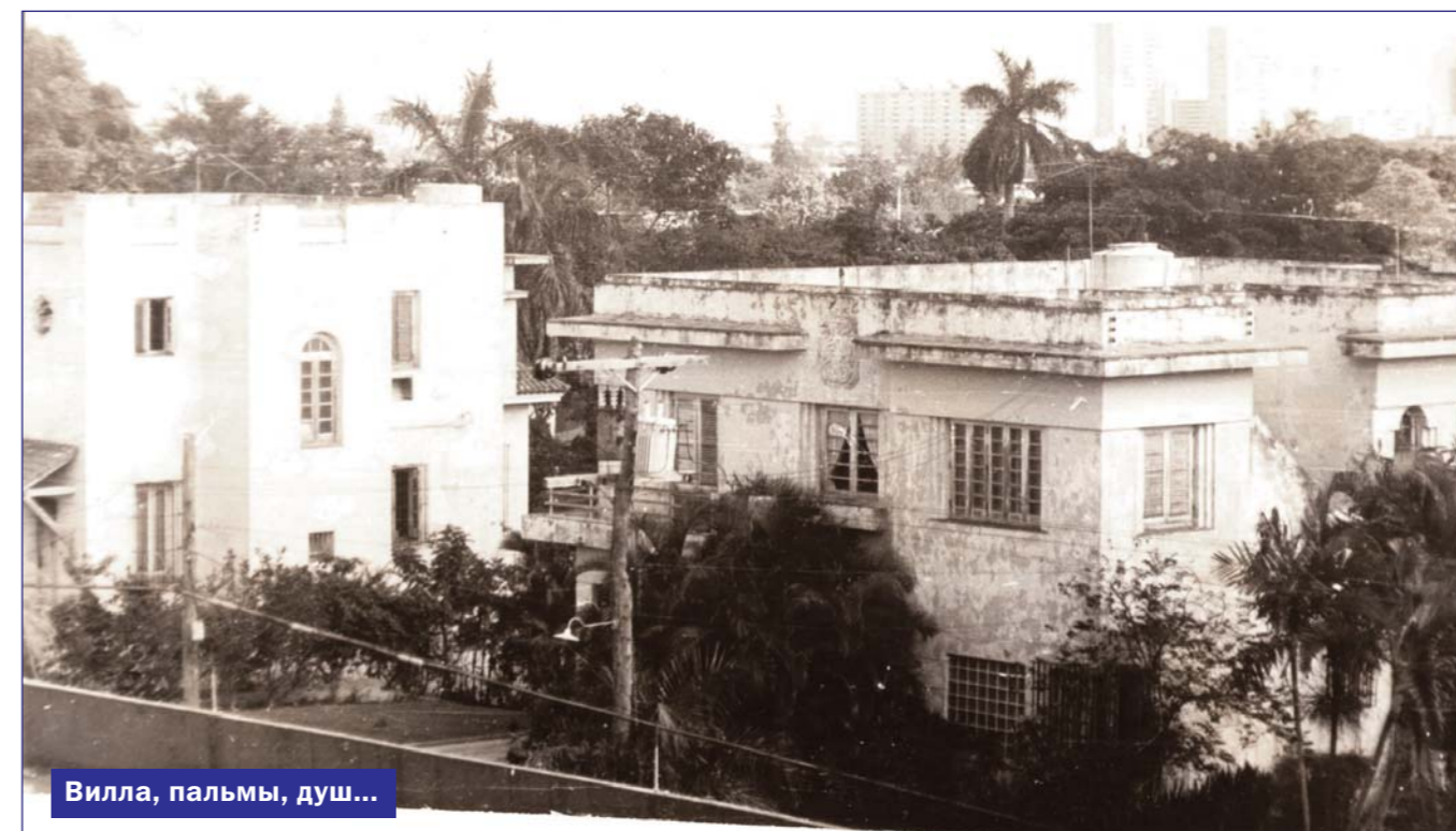
Вилла, пальмы, душ...